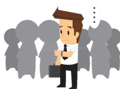
大筆轉帳、貸款、基金申請... 作業時間長