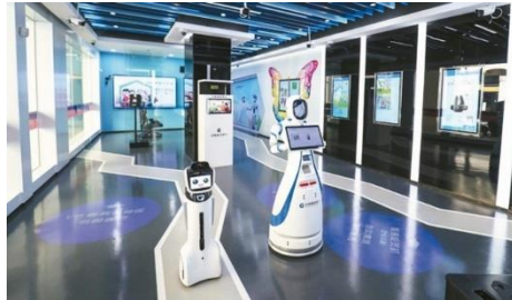
生物識別-刷臉取款