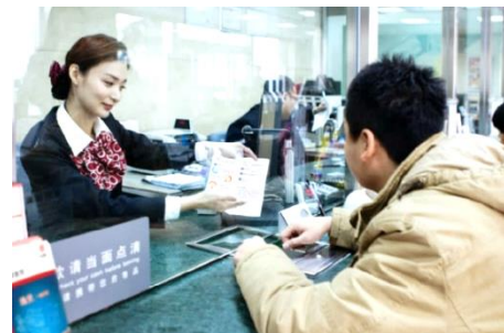
一人一櫃，臨櫃服務