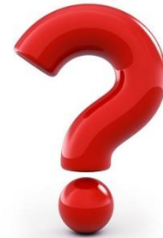
未來有更多其他的可能